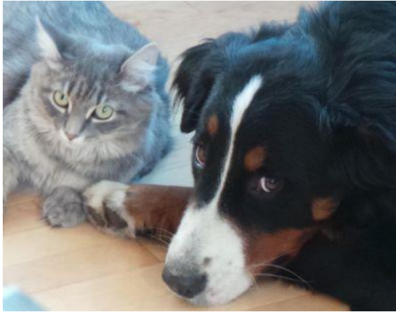
Denise Roy Kiosque #16