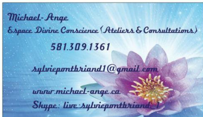
Sylvie Pontbriand Kiosque #13

Éveil de conscience au centre d'une méditation guidée