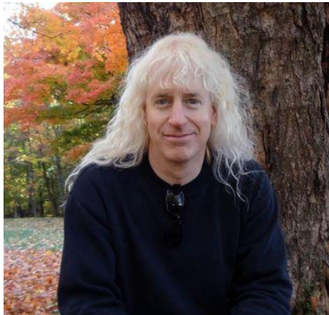
Bradfield Kiosque #29

Bradfield amène à chaque rencontre une vie entière d'exploration du coeur. Un conférencier créatif qui nous surprend en mélangeant une maîtrise de ses sujets avec une spontanéité rafraichissante, il est "Au Service du Grand Plan" dans chaque aspect de sa démarche. Ses ateliers et retraites sont des moments puissants de reconnexion qui nous aident à franchir le bruit quotidien pour s'aligner davantage dans notre plan de Vie. Sa créativité est prolifique avec maintenant 36 albums de styles variés qui rejoignent tous aspects de la spiritualité et du bien-être. Sa musique est reconnue comme étant hautement vibratoire, un outil puissant de transformation contenant des tonalités guérissantes. À la base auteur/compositeur/chanteur, la vision artistique de Bradfield est toujours en expansion, son accent les dernières années étant sur le visuel avec de nombreux vidéoclips et documentaires tournés sur 4 continents. Aspirant à élever la conscience collective et dévoué à la pureté d'intention, Bradfield s'appuie principalement sur son intuition pour nous guider tout doucement vers la Lumière de notre potentiel.